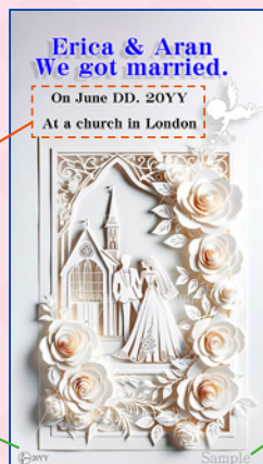
弊社マーク& 今年の年数